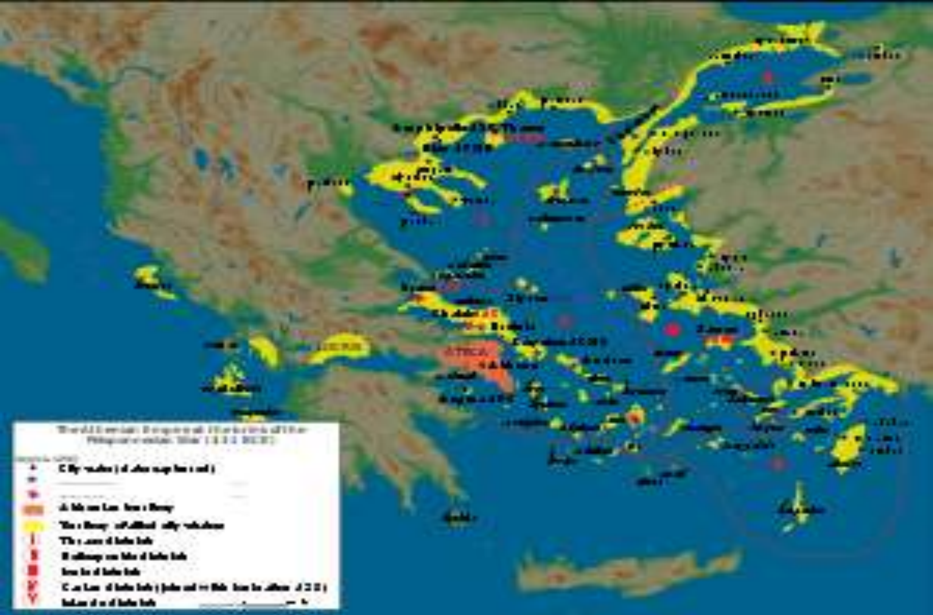
Liga Delos ("Kekaisaran Athena"), sebelum Perang Peloponnesos pada 431 SM.